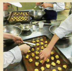
#バイオサイエンス科 #食品製造 #クッキー #お菓子作り