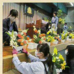
#フラワーファクトリ科 #草花専攻 #入学式 #フラワーアレンジメント #華道