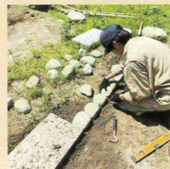
#2級造園技能士検定 #めざせ、全員合格!