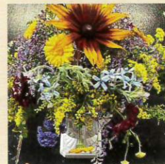
#フラワーファクトリ科 #草花デザインコース #ホリゾンタル型アレンジ