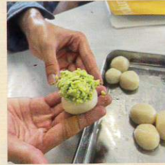
#フラワーファクトリ科 #野菜専攻 #枝豆 #ずんだ団子 #新鮮野菜