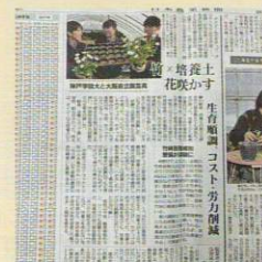
#植物バイオ部 #放棄竹林問題解消の研究 #日本農業新聞