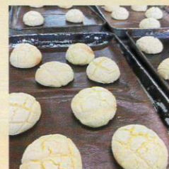
#バイオサイエンス科 #食品製造部 #パン作り #メロンパン