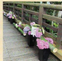
#フラワーファクトリ科 #池田城跡公園 #白ゆりまつり2024