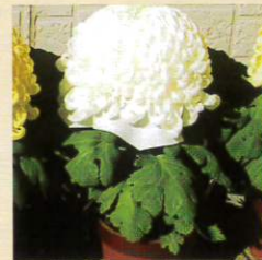
#フラワーファクトリ科 #福助菊 #日本菊花全国