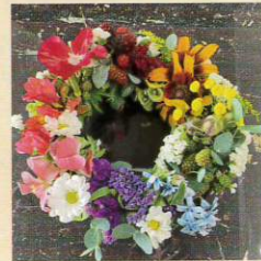
#フラワーファクトリ科 #草花デザインコース #生花 #リース #草花