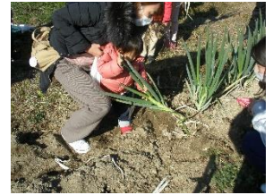
田辺大根（大阪産）白ネギの収穫