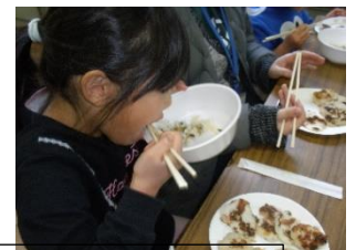
完成料理（もちもち大根）食事風景