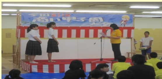
「釜揚げちりめん井楽会賞」7位