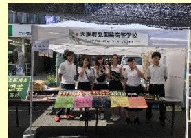
店舗レイアウト・販売ユニフォームの変更