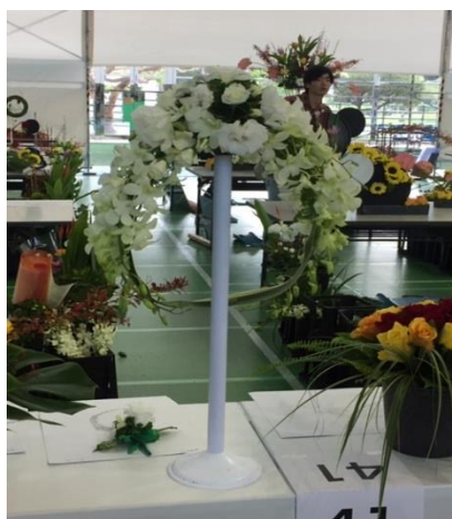
技能五輪 敢闘賞受賞作品（一部）