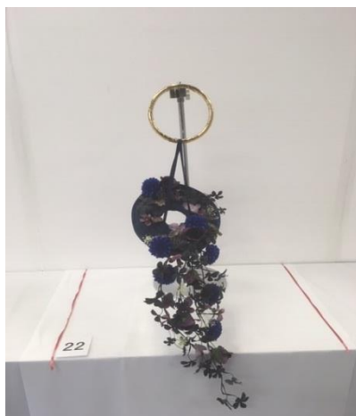
技能向上コンテスト 入賞作品