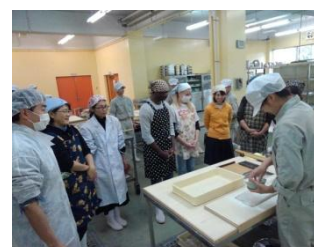
12月 そば打ち講習会